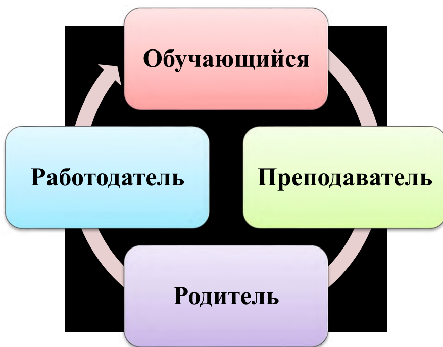
Схема 3. Субъекты образовательного процесса ГБПОУ БТПТиС

Субъектами образовательного процесса являются: